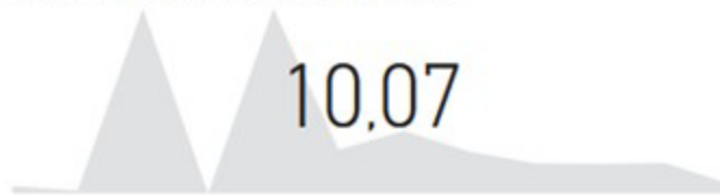
Μέσος όρος Αξία Πωλήσεων κατ'ά Ημ'νία Month